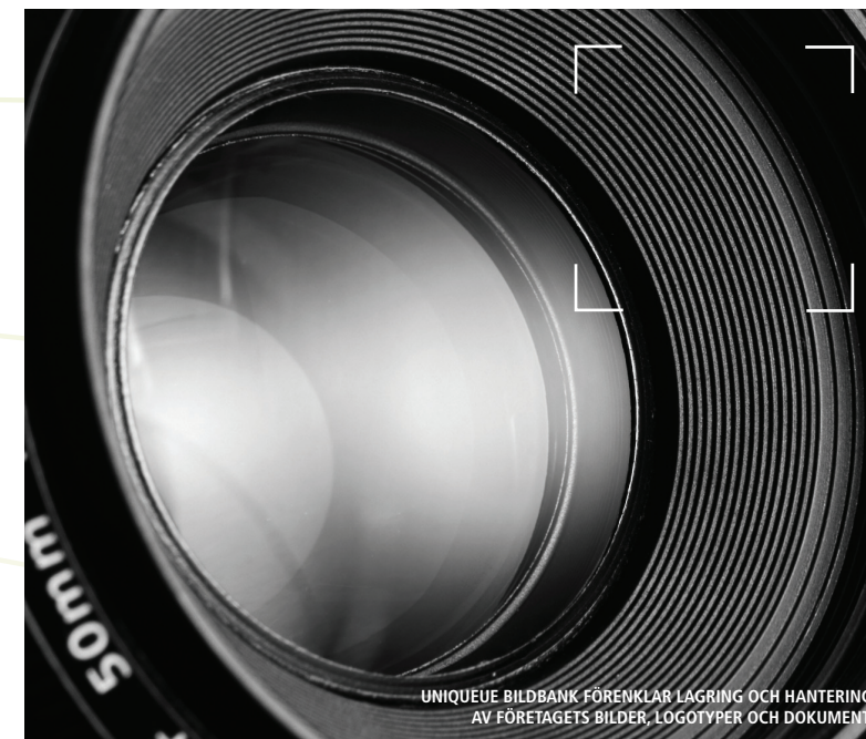
UNIQUEUE BILDBANK FÖRENKLAR LAGRING OCH HANTERING AV FÖRETAGETS BILDER, LOGOTYPER OCH DOKUMENT.

Detta innebär inte bara att du och ditt företag kan spara massor av pengar utan även att ni nu har möjlighet att öka produktionen och därför även har möjlighet att uppdatera och ge ut fler kataloger/prislistor per år. UniQueue Catalogue klarar koppling till de flesta affärssystem som används idag.